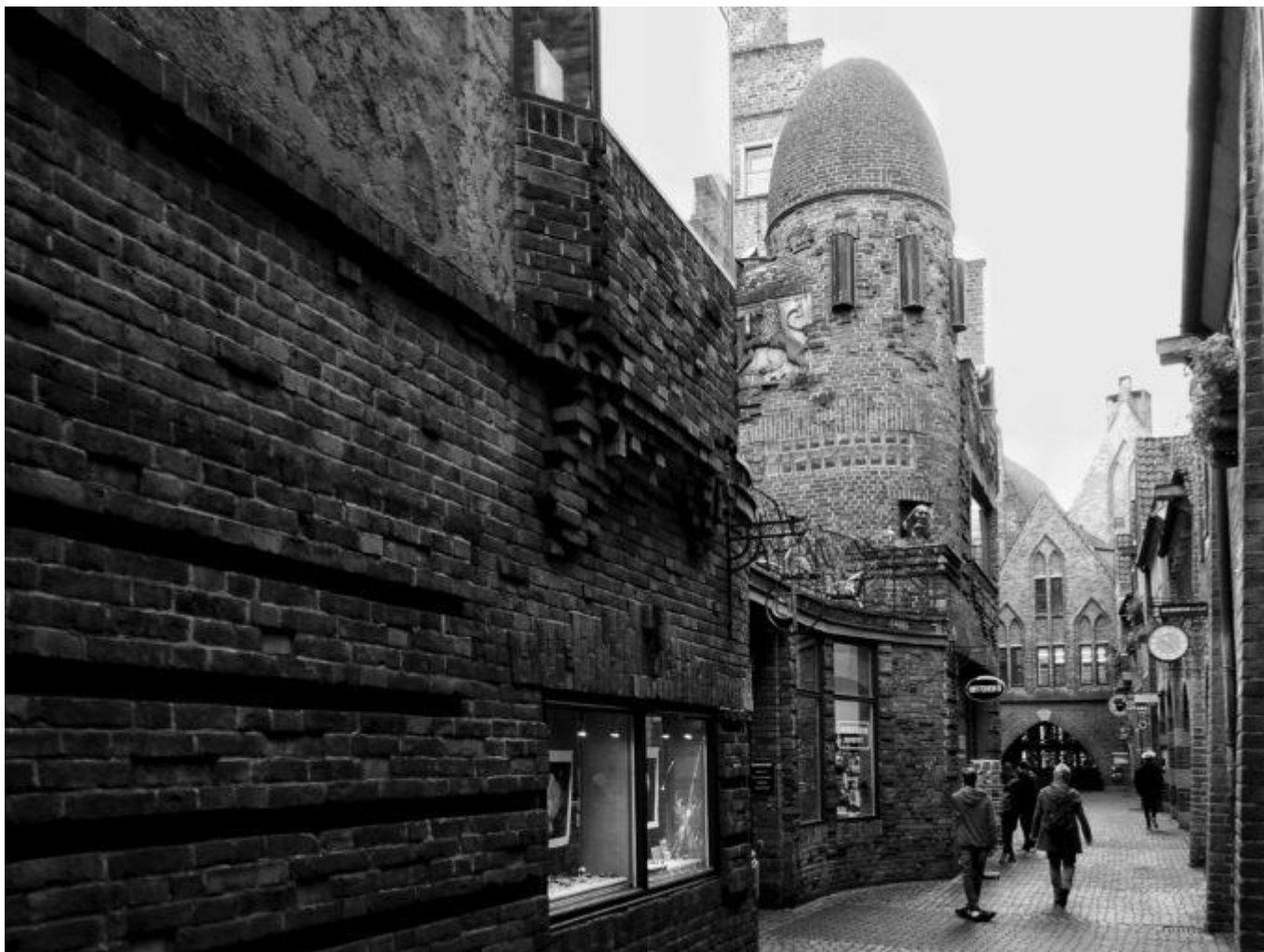
Dům Pauly Beckerové

Po cestě, kterou sledovala i Paula Beckerová, jdou nyní početné výtvarné kruhy z Drážďan a Mnichova. Expresionismus je jediný umělecký styl, který v zemi kdy vznikl, a když najde uplatnění i v místním němém filmu, stává se z něj neformální vizuální kód mladé republiky — a současně i synonymum pro všechno moderní.