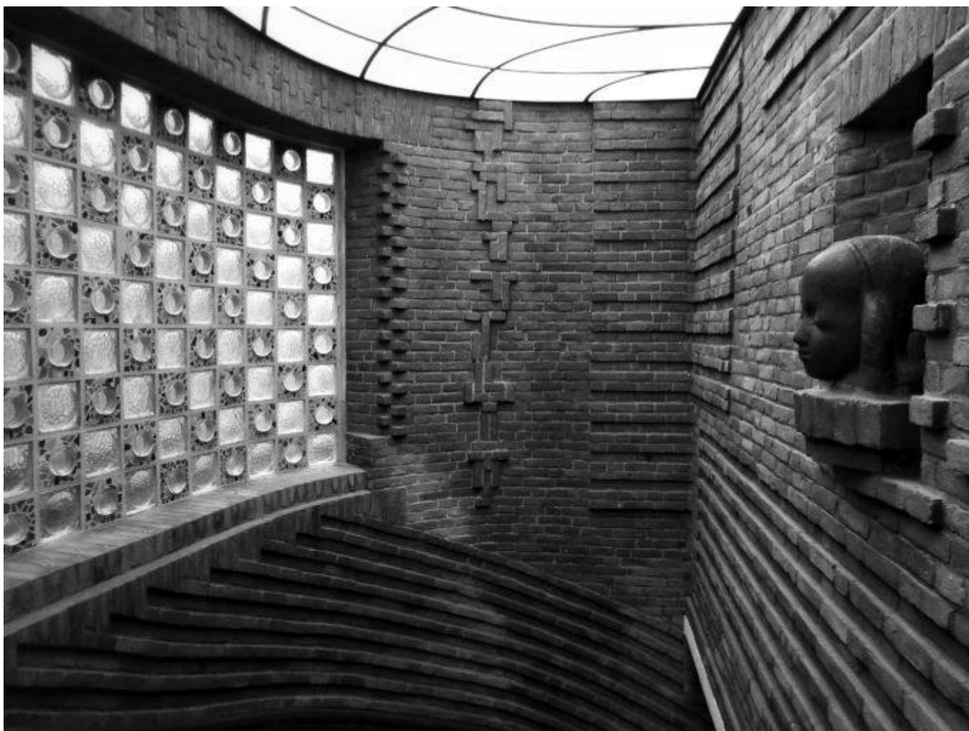
Dům Pauly Beckerové, foto: Vratislav Maňák

Je rok 1929, v Böttcherstrasse zůstává poslední neobsazená proluka a nyní na ní roste hold dolnoněmeckému atlant'anství.